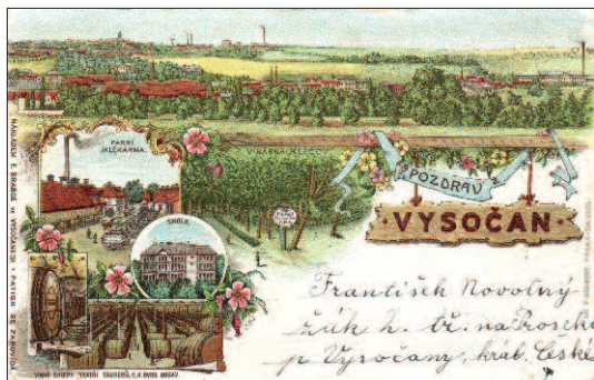
BAREVNÁ LITOGRAFICKÁ POGLEDNICE VYSOČAN Z PŘELOMU STOLETÍ S VYOBRAZENÍM VINNÝCH SKLEPŮ FIRMY BRATŘI TAUBERŮ.