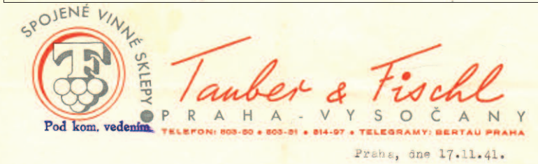
Hlavičkové papíry z roku 1941. Název firmy Tauber a Fischl byl sice zachován, ale do- datečný text „Pod kom. vedením“ upozorňuje, že ji původní majitelé již nespravovali.