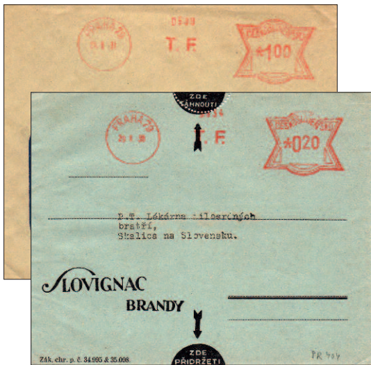
Obálky firmy Tauber a Fischl s OVS z roku 1931 a 1938.

Po spojení firmy s rodinou Fischlů v roce 1931 již nemáme doloženo žádné použití perfinů. Ostatně strojek s perfinem B.T. již byl v té době značně opotřebovaný a perfiny vyrážel dosti nečistě. To už ale byla doba, kdy se rozšiřovalo používání výplatních strojků, které začaly perfiny postupně nahrazovat. Firma Tauber a Fischl si proto takový strojek brzy pořídila, jak je patrné z následujících vyobrazení.