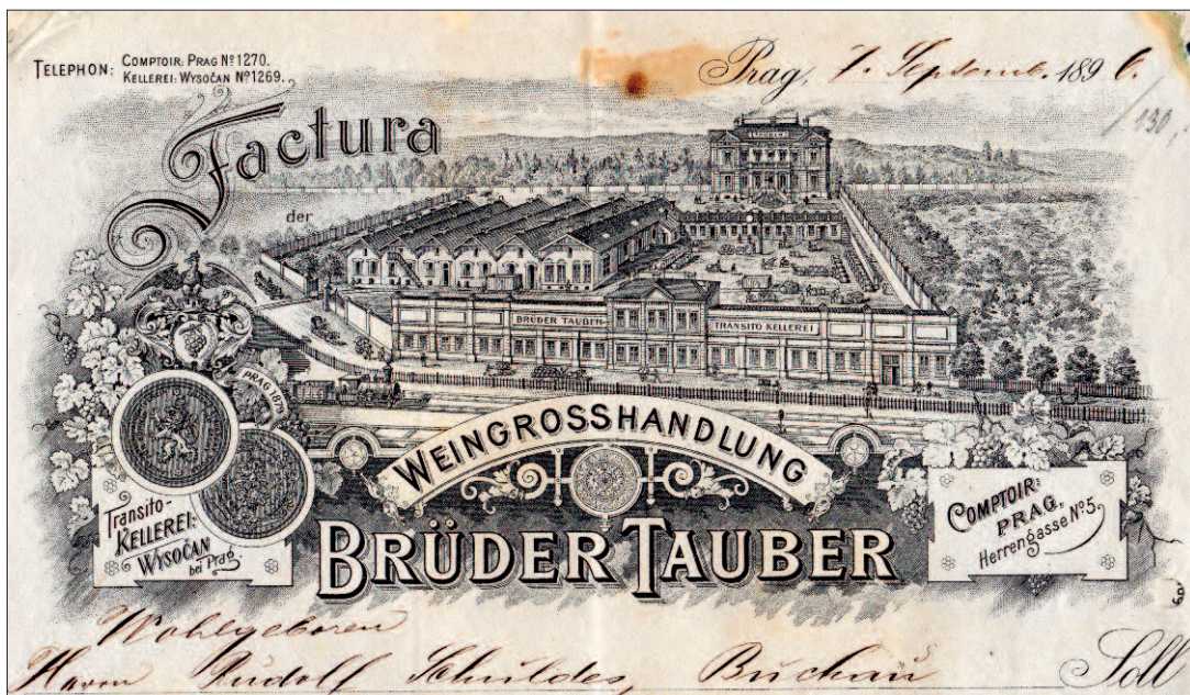
HLAVIČKA FAKTURY Z ROKU 1896 (V TYPICKÉM PŘEVODNÍ ZPŮSOBU Z TĚ DOBY) S VYOBRAZENÍM ZÁVODU FIRMY BRATŘI TAUBERŮ.