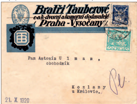
Dopis z října 1920 s frankaturou dvou emisí.