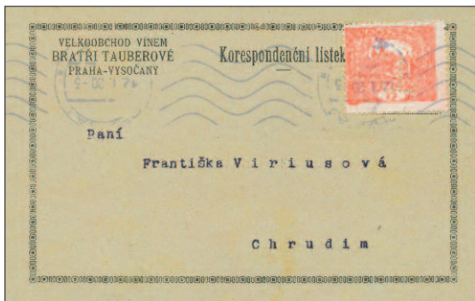
Lístek z ledna 1920; známka s nově doloženým perfinem T.

Vedle popsaných tří perfinů byl nedávno doložen čtvrtý, opět v podobě písmene T, ale jiné velikosti a provedení. Na smyté známce jsme jej sice znali už dlouho, ale pro nedostatek dalších dokladů nezařadili do katalogu perfinů z čs. území. Teprve nedávný objev identifikační celistvosti nám umožnil určit jeho uživatele. Zdá se, že používán byl jen výjimečně a tomu odpovídá i jeho vzácný výskyt. Dosud jej známe pouze na známkách emise Hradčany.