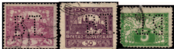
Perfin B.T. lze nalézt na velmi běžných i méně často se vyskytujících známkách - zde se soukromým zoubkováním.

smíšené frankatuře s rakouskými známkami. Takový doklad je nepochybně velice vzácný a k vidění je např. v exponátu J. Malečka umístěném na Exponetu.