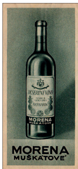
Ukázka viněť, které firma používala na své produkty.