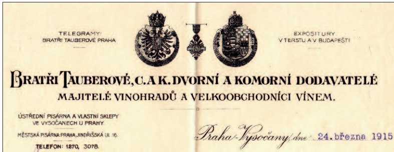
Z hlavičkového papíru (1915) zjistíme například, že firma měla expozitury v Terstu a Budapešti a že v té době měla kancelář v Jindřišské ulici v centru Prahy.

V případě firmy Bratří Tauberů jsme její historii dokumentovali materiály pocházejícími z doby před třemi čtvrtinami století - a staršími. Skončili jsme ve čtyřicátých letech, což mimoděk ukazuje, jak potřebné jsou materiály novější, i současné. Právě jimi by šlo dobře doložit další historii tohoto podniku, s velkou pravděpodobností až do dnešních dnů (neboť přes všechny dějinné zvraty nejspíš dodnes tvoří součást některé fungující firmy). To je však už úkol pro další badatele, který náš dnešní perfinářský exkurs samozřejmě přesahuje. Pokud by se jej některý ze čtenářů ujal, bylo by hezké, kdyby se svými zjištěními seznámil čtenáře našeho časopisu. ■