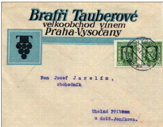
Dopis z října 1925, se změněným firemním logem.

Perfin B.T. byl používán až do začátku třicátých let, tedy do doby, kdy došlo ke změně majitelů a s tím ke změně názvu firmy na Tauber a Fischl.