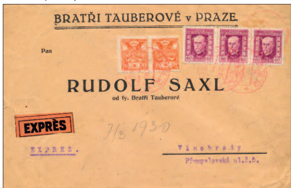
Spěšný dopis ze 7. 3. 1925 s červeným razítkem (den narození T. G. Masaryka).